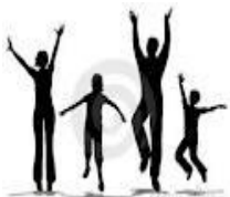
D la familia