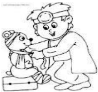
B El Doctor