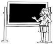
A la maestra

Puerto Vallarta a disfrutar del mar y la alberca. ¿Quién toma la decisión de ir a vacaciones?